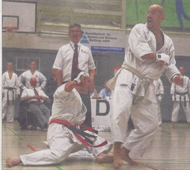
Nach 25 Jahren Teilnahme und vielen Erfolgen endeten Schlatts (rechts) letzte Kämpfe mit Platz eins.